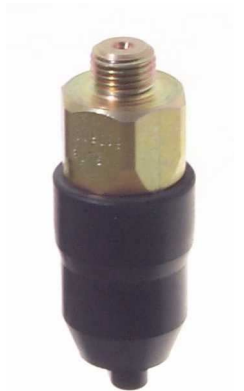
DS-S-42 mit Schutzkappe