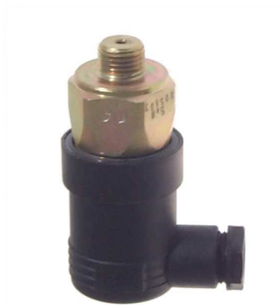
DS-W-230 mit Winkel - Anschlußstecker