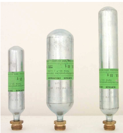
Verschiedene CO 2 - Flaschen, F - Gewinde